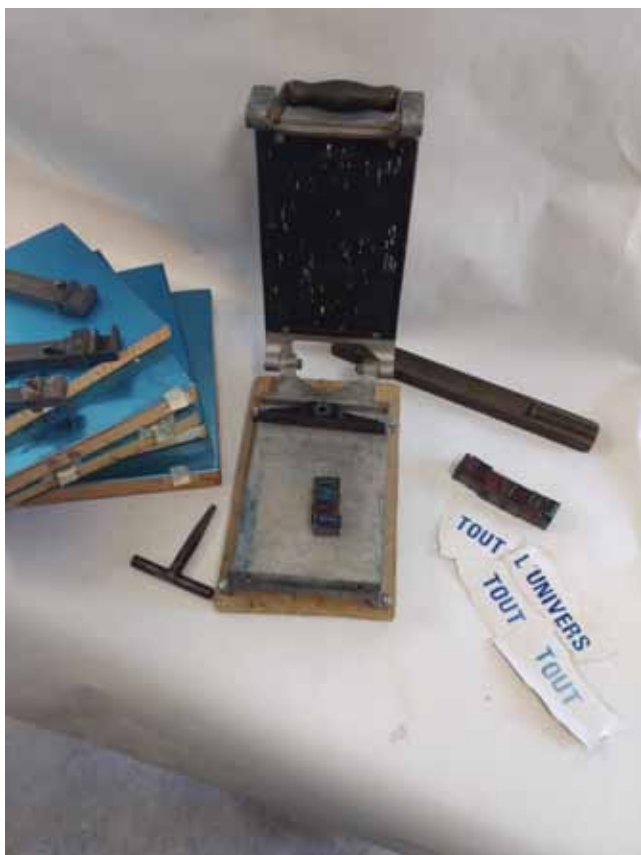
Le matériel de base : presse, composteurs, boîtes de caractères et encres. Les lettres peuvent être imprimées directement sur une feuille grand format, ou sur des bandes de papier qui seront ensuite collées.

Cette proposition a donc des règles techniques strictes et identiques pour chaque nouvelle édition : utilisation du caractère Univers, impression et composition manuelle. Mais les sujets peuvent changer à l'envie.