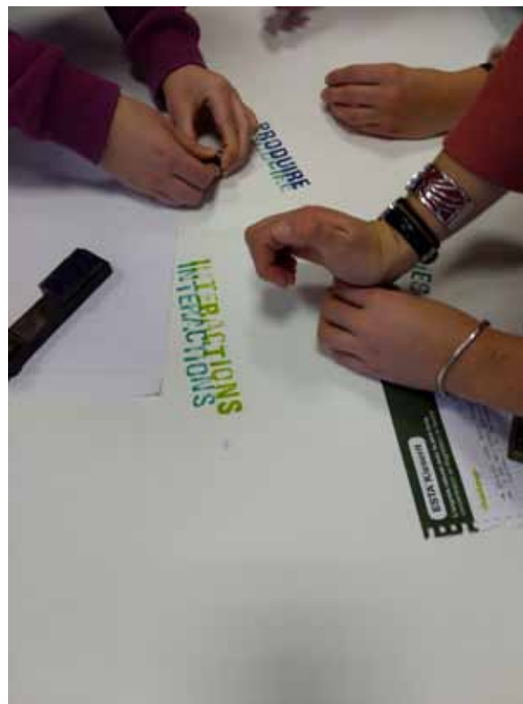
Pression manuelle. Les élèves doivent réfléchir à la mise en page générale. C'est un travail personnel qui vient s'inscrire dans une production collective.